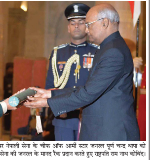
नई दिल्ली में राष्ट्रपति भावन पर नेपथी सेस के चीफ ऑफ आर्मी स्टार जनरल पूर्ण चंद्र थापा को सुकीर्ति मया राष्ट्रपि पर भारतीय सेना को जनरल के मानद र्केन प्रदान करते हुए राष्ट्रपति राम नाथ कोविंद।

तलाक-ए-बिहत यानी तीन तलाक की प्रथा को दंडनीय बनाये बनने संबंधी मुद्दिस