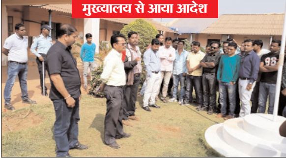
मुख्यालय से आया आदेश

जगदलपुर, 7 दिसम्बर (सन्सू)। एनएसडीसी नगरना इस्पात संयंत्र के प्रभावितों ने नौकरी देने में देरी को लेकर सरत्र प्रभावित नामिनी आर-पार को लड़ाई करने के लिए कार्यालय के बाहर रोज धरना-प्रदर्शन का निरण लिया था। 11 दिसम्बर तक शांति पूर्ण धरना-प्रदर्शन के बाद उा आदिलन की चेतावनीदेई गई थी। भू-प्रभावितों की आदिलन को देखते हुए एनआइएसी प्रबंधन ने अन्ततः 7 जनवरी 2019 से नियुक्ति देने का फरमान जारी कर दिया है।