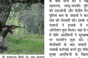
इलाके में आतंकीयों को मौजूदगी के इन्फुस मिले थे। इस स्थान